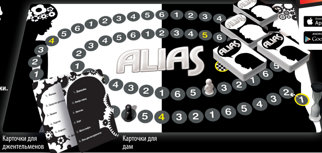
Карточки для джентльменов

Комплект игры: 400 карточек с 2400 словами, игровое поле, песочные часы, 2 игровые фигурки.