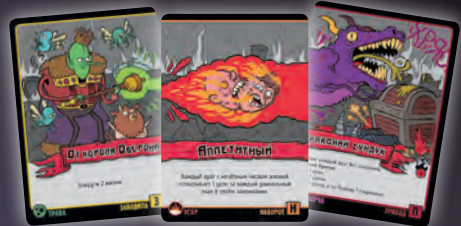
ЗАВОДИЛА + НАВОРОТ + ПРИХОД

Заметил ленту с названием карты? У выложенных рядом карт всех трёх типов получается общее название, состоящее из начала, середины и конца. Заводилы всегда кладутся в левую часть заклинания, навороты — в середину, а приходы замыкают заклинания справа.