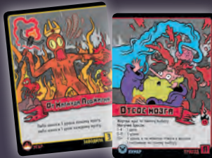
ЗАВОДИЛА + ПРИХОД