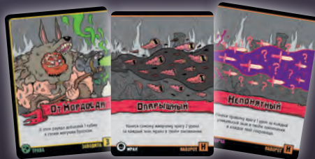
ЗАВОДИЛА + НАВОРОТ + НАВОРОТ