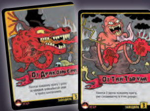
ЗАВОДИЛА + ЗАВОДИЛА