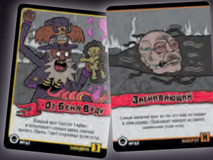
ЗАВОДИЛА + НАВОРОТ