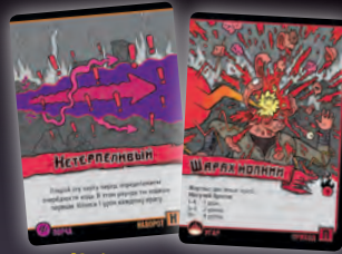
НАВОРОТ + ПРИХОД