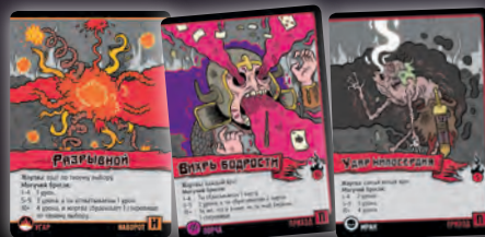
НАВОРОТ + ПРИХОД + ПРИХОД

Если колдун открывает неправильное заклинание, он обязан убрать из него лишние карты, чтобы заклинание стало правильным (например, из последнего примера убрать лишний приход). Все лишние карты уходят в стопку сброса.